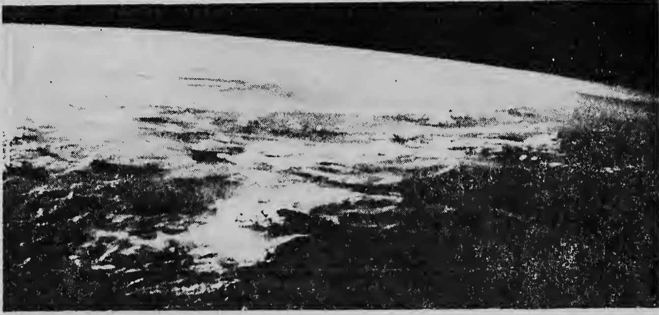
Bista Aki E Astronautanan Tabatin For Di A Bordo di Molly Brown foto sacé pa John Young den orbita